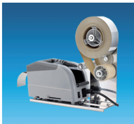
Support de rouleau, permet d'enlever la protection