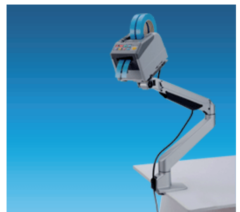
Support type bras